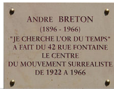
Plaque 42 rue Fontaine (Paris), où il vécut.