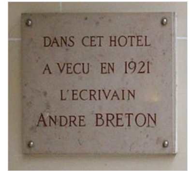
Plaque 35 rue Delambre (14 e arrondissement de Paris) devant l'hôtel Delambre, où André Breton vit en 1921.

d'Apollinaire : l' Esprit nouveau paré du bon sens français et son horreur du chaos 25 , ni du réveil de Paul Valéry 26 , pas plus que des « modernes » Jean Cocteau, Raymond Radiguet, Pierre Drieu la Rochelle perpétuant la tradition du roman qu'il rejette (et rejettera toujours).