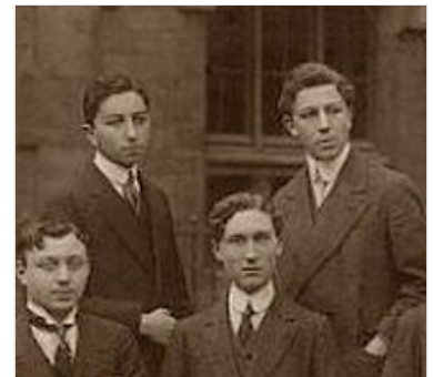
André Breton (en haut à droite) à côté de Théodore Fraenkel, détail d'une photo de classe au lycée Chaptal en 1912.