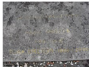
Détail de la tombe.

En 1960, il signe le « Manifeste des 121 », déclaration sur le droit à l'insoumission dans la guerre d'Algérie. Parallèlement, il s'engage dans la défense du droit à l' objection de conscience , entre autres en parrainant le comité créé par Louis Lecoin , aux côtés d' Albert Camus , Jean Cocteau , Jean Giono et l'abbé Pierre. Ce comité obtient un statut, restreint, en décembre 1963 pour les objecteurs.