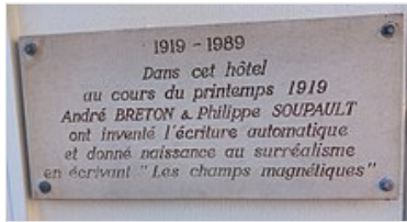
Plaque commémorative de l'écriture automatique

d'Apollinaire : l' Esprit nouveau paré du bon sens français et son horreur du chaos 25 , ni du réveil de Paul Valéry 26 , pas plus que des « modernes » Jean Cocteau, Raymond Radiguet, Pierre Drieu la Rochelle perpétuant la tradition du roman qu'il rejette (et rejettera toujours).