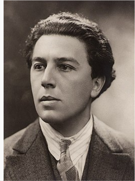
André Breton photographié par Henri Manuel en 1927.