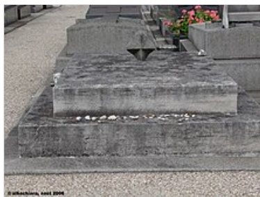
Tombe d'André Breton au cimetière des Batignolles , à Paris.

En 1958, il signe avec d'autres surréalistes le tract du Comité de Lutte Anti-Nucléaire (CLAN), Démasquez les physiciens, videz les laboratoires , qui stigmatise les scientifiques au service des armements nucléaires 59 .